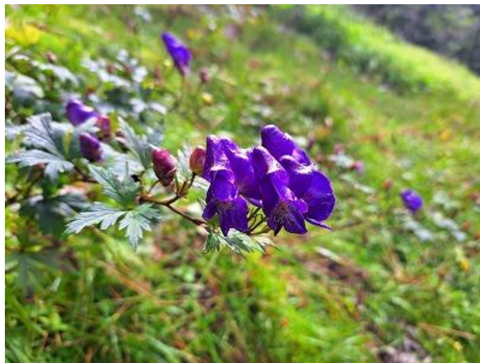
シコクブシ【キンポウゲ科、トリカブト属】 Aconitum grossedentatum var. sikokianum