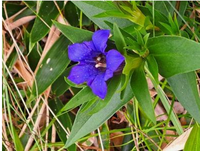
ミヤマリンドウ【リンドウ科リンドウ属】（深山竜胆、学名： Gentiana nipponica ）