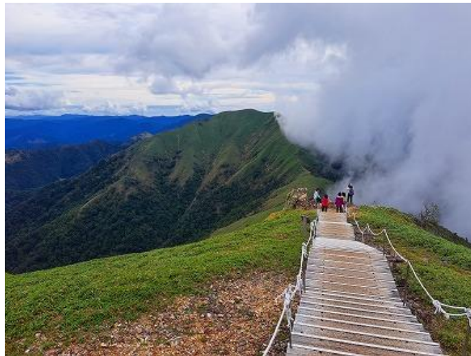
雲がかかる次郎笈