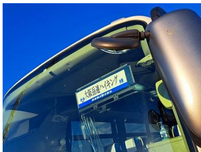
大阪府山岳連盟のハイキングと山スクールの企画で剣山を目指します！