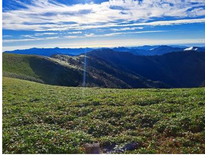
ミヤマクマザサに覆われた山頂