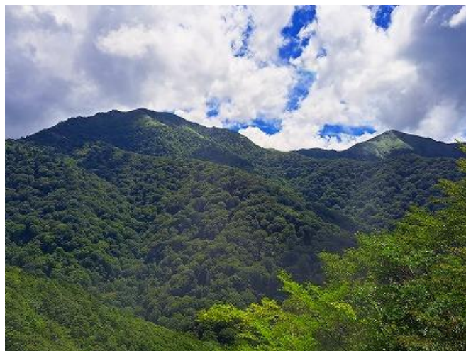
剣山（太郎笈）と次郎笈