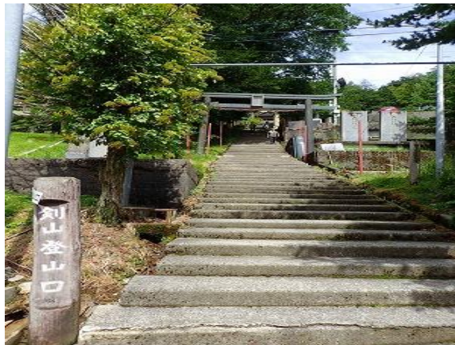
劔神社への石段からスタートします。