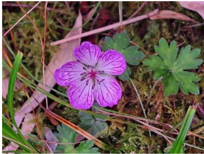
シコクフウロ（イヨフウロ） Geranium shikokianum 【フウロソウ科、フウロソウ属】

本州中部地方以西、四国、九州の深山に生える多年草で、和名は初め四国産の標本に基づいたものとされます。花は夏、2花からなり花径3cmくらい、花弁は濃紅紫色の脈が目立ち、花弁の先が3裂するものと、裂