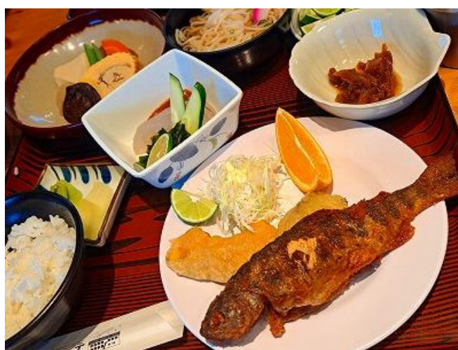
昭和中期からの定番、アマゴの唐揚げは大人気です。