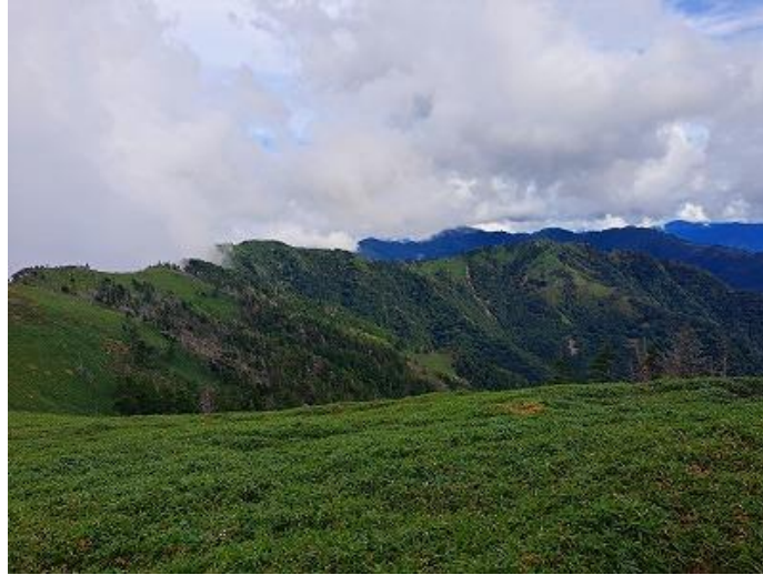
古道がある一の森方面