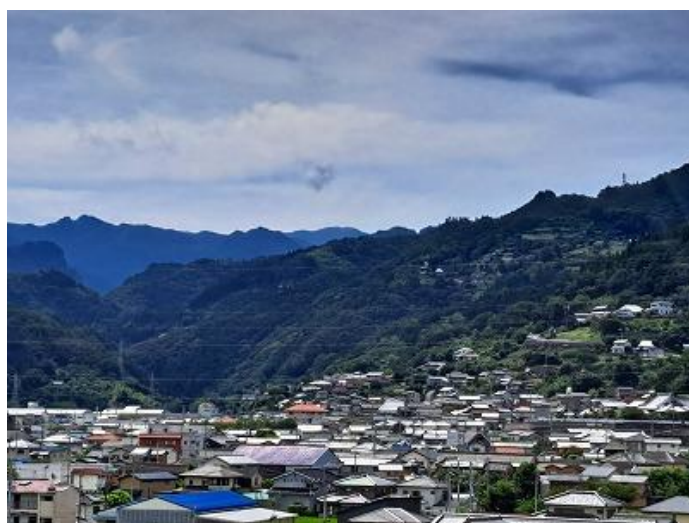
つるぎ町の道の駅（展望台）から南に剣山を望みます。