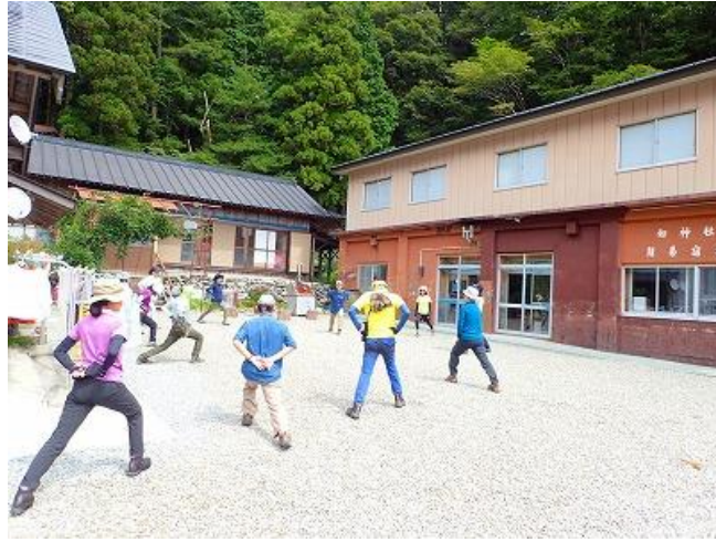
入念にストレッチ