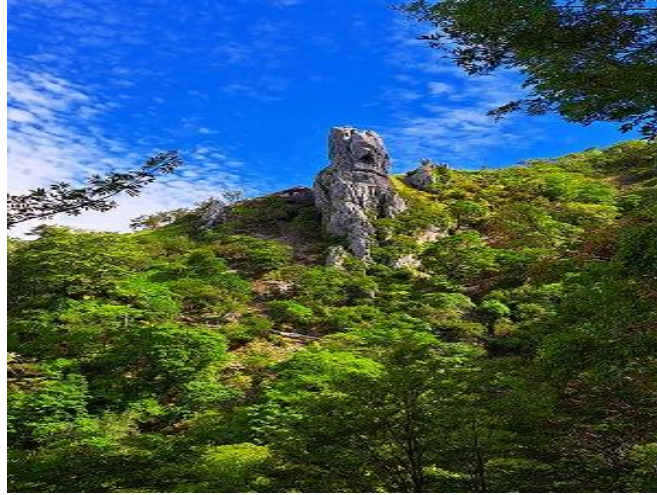
大劔神社のご神体は高さ50Mの御塔石(おとうせき)