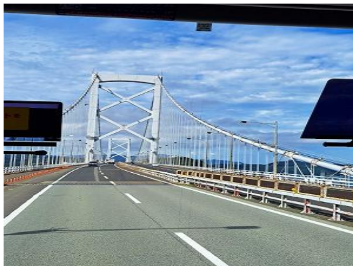
大鳴門橋を渡ります。