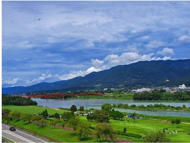
四国三郎・吉野川

「板東太郎」の利根川、「筑紫二郎」の筑後川とともに、日本の三大暴れ川に数えられ、阿波は全国でも有数の洪水国でした。