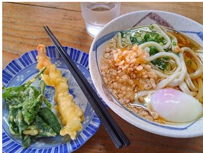
うどん屋「のぶ」で腹ごしらえ！

「板東太郎」の利根川、「筑紫二郎」の筑後川とともに、日本の三大暴れ川に数えられ、阿波は全国でも有数の洪水国でした。