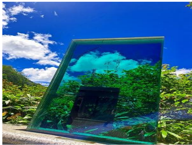
さわやかな月光の花は 凜として気高い 宮尾登美子