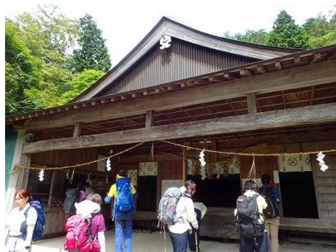
安全登山を祈願して・・・